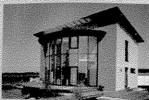
Das Passiv Sonnenhaus