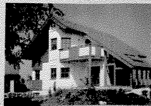
Klassiker in vielen Variationen

Wunderschöne Häuser in verschiedenen Ausbaustufen schon ab € 123.900,-